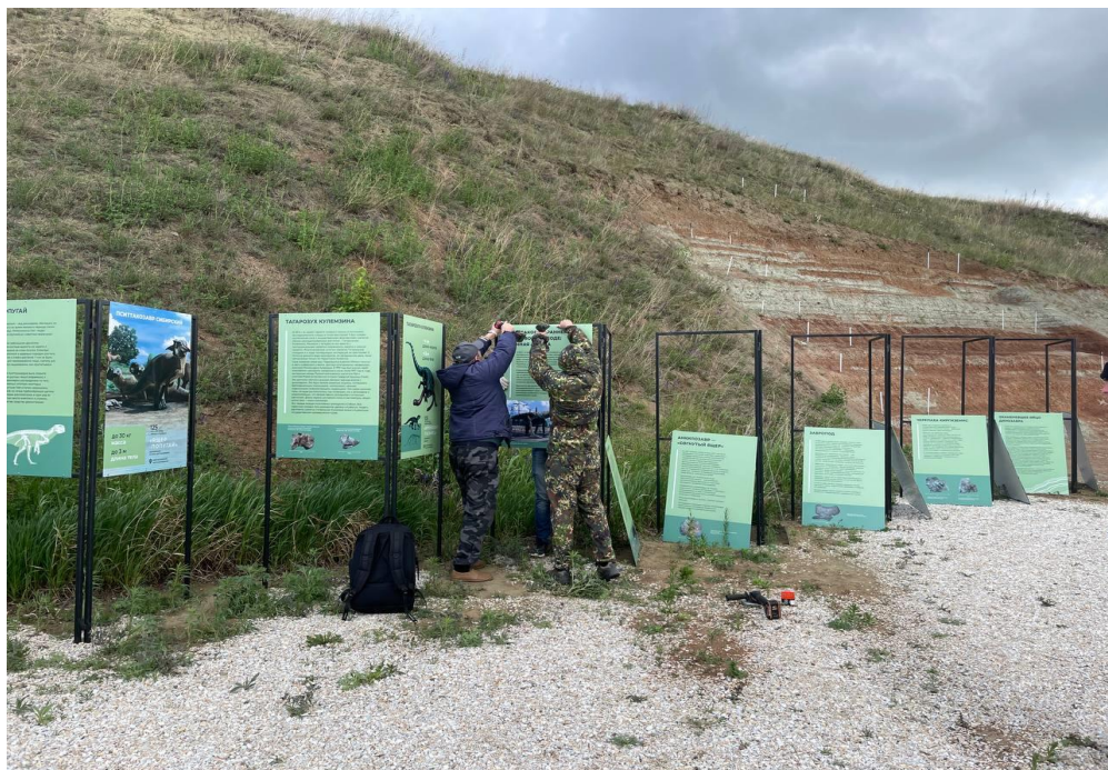
Рис 3: Монтаж планшетов на металлические конструкции

Параллельно начался монтаж локаций музея под открытым небом.