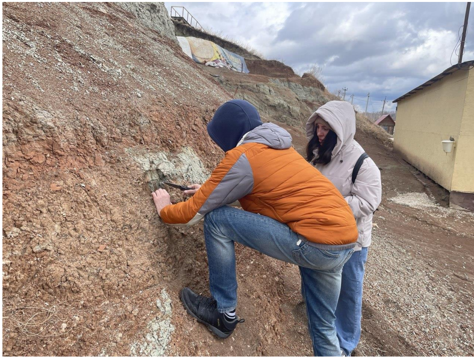
Рис 2: Извлечение плечевой кости Пситтакозавра из стены обнажения

С появлением первых находок 2025 года, в лаборатории палеонтологии началось заполнение экспедиционно-отчётной документации (полевой дневник и полевая опись), а также по вечерам происходит камеральная обработка палеонтологических образцов.