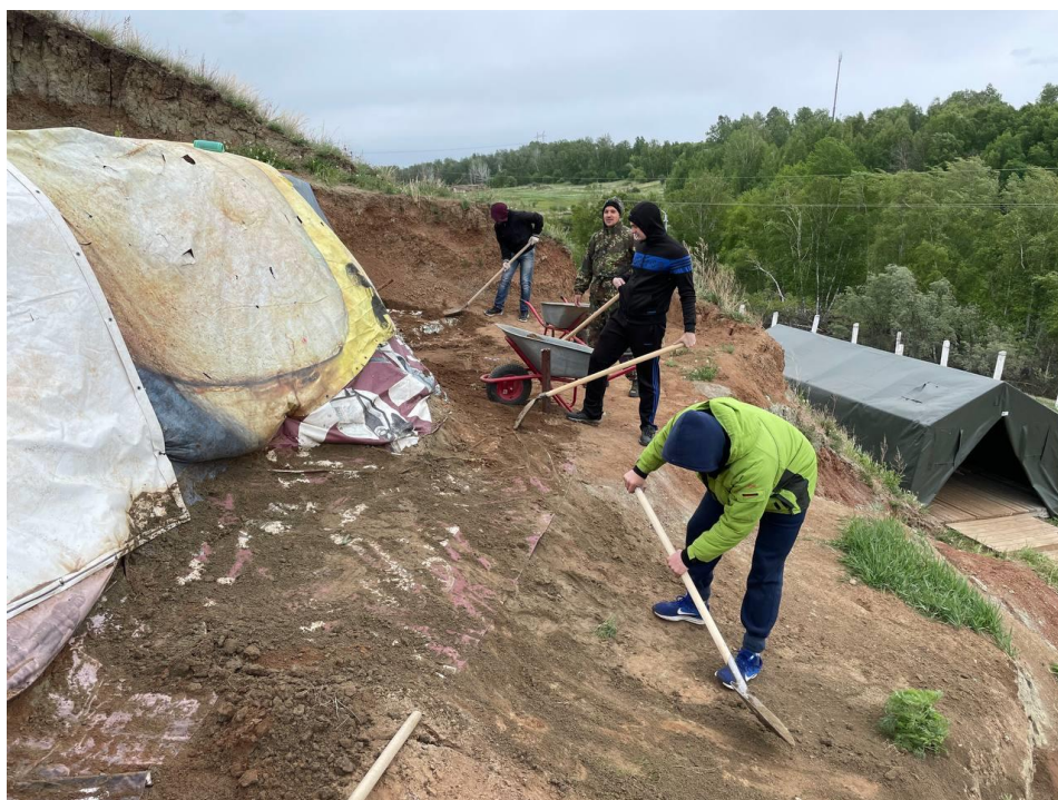
Рис5: Расконсервация нижнего участка

С 27 мая по 29 мая проходили работы по расконсервации раскопа, рекогносцировки и восстановлению координатной сетки. В результате был расконсервирован участок в северо-западной части раскопа и нижний участок на уровне квадратов С, D, E.