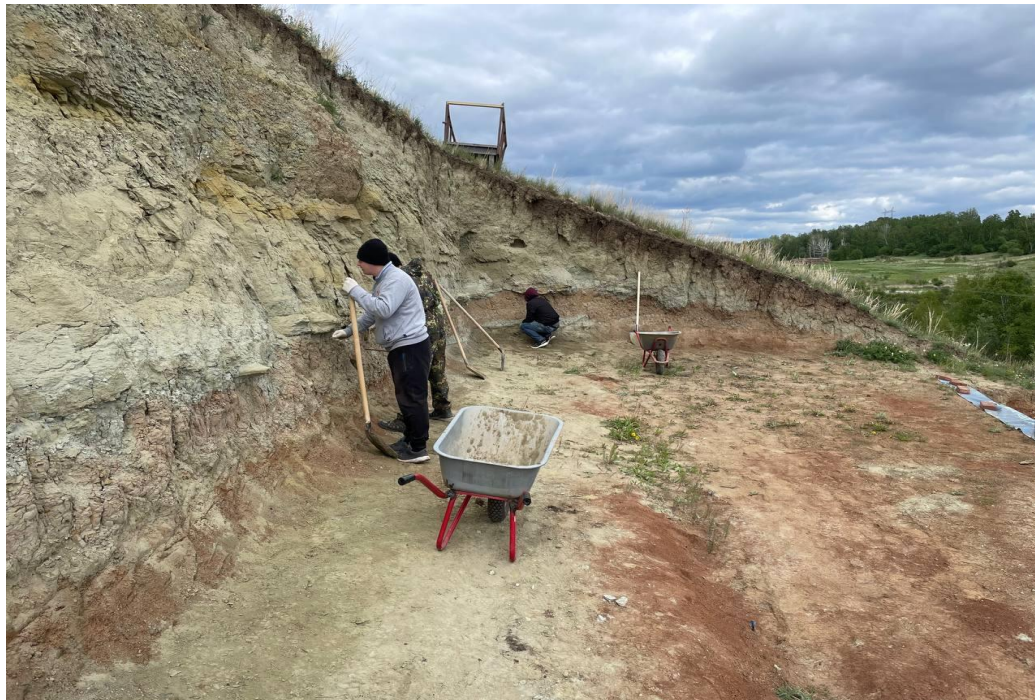
Рис 1: Осмотр стенок раскопа на наличие костных остатков.

XII полевой сезон стартовал 15 мая с заезда отряда в здание филиала музея. В лаборатории палеонтологии были оборудованы дополнительные рабочие места, смонтированы зоны для оцифровки находок (фотофиксация фотогранометрия), настроено оборудование для препарирования. На следующий день был совершён выезд на местонахождение Шестаково-3 с целью тщательного обследования естественных обнажений и расчистки осыпи породы, где удалось обнаружить несколько фрагментов костных остатков, включая тело позвонка хвостового позвонка Psittacosauus sp. ( Пситтакозавра ).