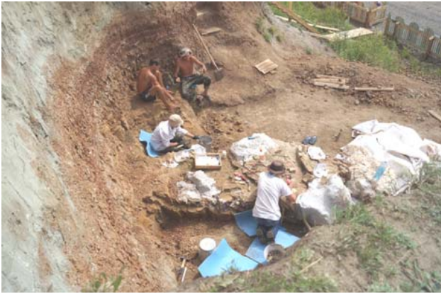
Рис. 3. Общий вид костеносной линзы на местонахождении Шестаково-3

На уровне 0,3 м от кровли этой пачки залегала костеносная линза со скелетами пситтакозавров. В ходе раскопок были определены границы этой костеносной линзы и сделана дополнительная прирезка раскопа на 1,8 м вглубь склона. Особенности тафономии костеносной линзы говорят, что ее исследованная часть около метра шириной и около 4,5 м длиной простирается северо-востока на юго-запад. Мощность линзы около 60 – 70 см (рис. 3).