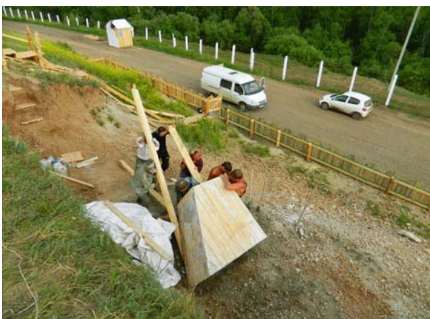
Рис. 4. Переворот монолита № 1

Следует отметить, что за 20 лет исследований Шестаково – это первые масштабные раскопки, проводимые по принятой научной методике. Это принципиально важно, поскольку до начала работ КОКМ в Шестаково не было известно линз со скелетами нескольких пситтакозавров разного индивидуального возраста. Извлечение находок проводилось вместе с вмещающей породой по технологии, принятой для палеонтологических раскопок. Скелеты протозухий, фрагменты скелетов пситтакозавров были взяты с помощью гипсовых «пирогов». Наиболее полные скелеты пситтакозавров из костеносной линзы были взяты с помощью монолитов (рис. 4, 5).