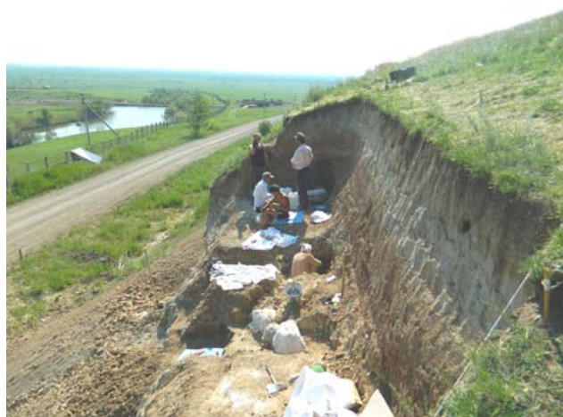
Рис. 2. Раскоп на местонахождении Шестаково-3 (июнь 2014 г.)

На глубине около 1 м ниже уровня почвы в разрезе Шестаково-3 представлены аллювиальные отложения раннего мела, включающие останки наземных позвоночных: слой буро-красных плотных глин (мощностью 1 м) и пачка переслаивающихся буро-красных и зеленовато-серых плотных глин. В этих отложениях были найдены черепа, фрагменты отдельных костей и фрагменты скелетов позвоночных раннего мелового периода: протозухий Tagarosuchus kulemzini (мезозойских архаичных крокодилов), ящериц (предварительно определенных как агамовые) и динозавров Psittacosaurus sibiricus .