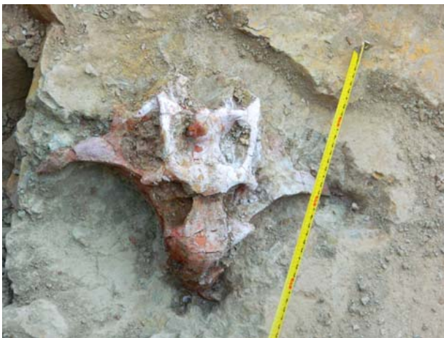
Рис. 6. Череп пситтакозавра сибирского в породе