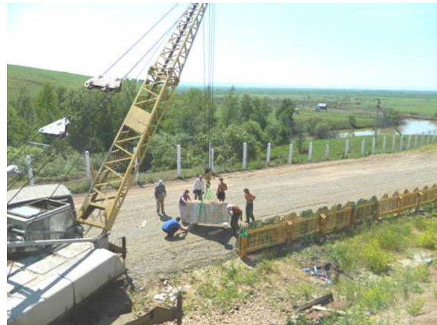
Рис. 5. Вывоз монолита № 1 с помощью автокрана

Уникальность обнаруженной костеносной линзы заключается в качестве и количестве найденных в ней полных скелетов пситтакозавров. На настоящий момент Шестаково-3 является единственным местонахождением в России, где встречено массовое захоронение полных скелетов динозавров. Особенности тафономии позволили специалистам предположить, что гибель группы динозавров, состоящих из особей разного индивидуального возраста, произошла вследствие катастрофического события. Возможно, это был кратковременный селевой поток в русле временного водотока, по которому двигались пситтакозавры. Такая ситуация ранее не была известна как для местонахождения Шестаково, так и других местонахождений динозавров на территории России [7, с. 74 – 80; 8, с. 17 – 18; 10, с. 62].